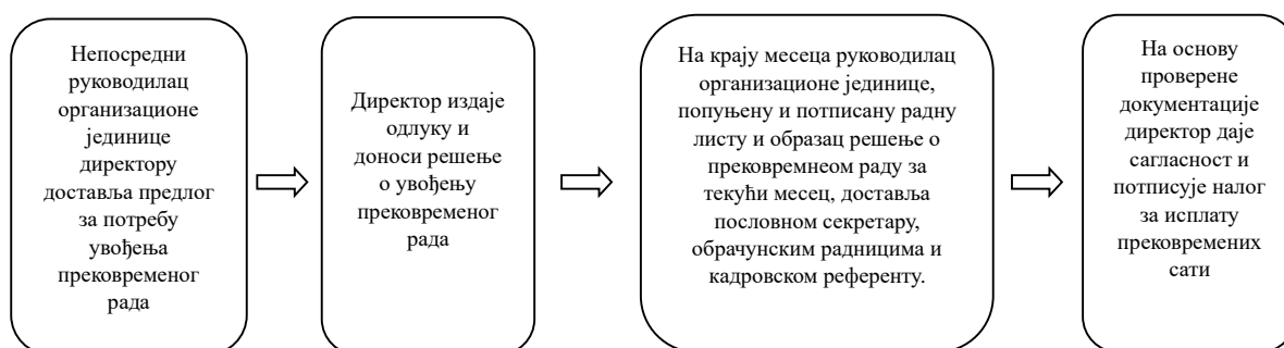
Слика број 4. Шематски приказ Процедуре о прековременом раду број 4253/2023 од 03. августа 2023. године

У Процедури о прековременом раду није наведен начин на који се утврђује потреба за увођењем прековременог рада директора здравствене установе и уводи прековремени рад за ово лице, као и начин извештавања о обављеним пословима за време прековременог рада директора.