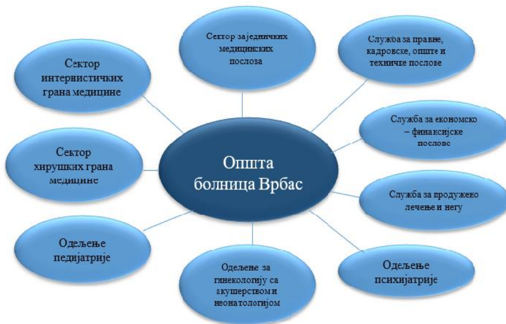
Слика број 2. Приказ унутрашње организације Опште болнице Врбас према одредбама Правилника

У наредној табели дат је упоредни приказ организационих ентитета утврђених одредбама члана 12 став 1 Статута Опште болнице Врбас и одредбама члана 6 Правилника.