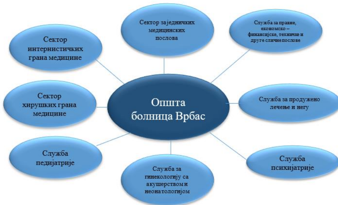
Слика број 1. Приказ унутрашње организације Опште болнице Врбас према одредбама Статута

Ради сагледавања будуће организационе структуре Опште болнице, која треба да буде уређена новим статутом донетим на основу важећег Закона о здравственој заштити, извршен је увид и у Предлог статут Опште болнице Врбас број: 2481/5/2023 усвојен на седници Управног одбора од 17. маја 2023. године. Поред тога, извршен је увид и у претходно мишљење Министарства здравља број: 110-00/134/2023-02 од 26. маја 2023. године, дато сагласно одредби члана 124 став 3 Закона о здравственој заштити. Наведеном одредбом прописано је да на одредбе статута здравствене установе чији је оснивач аутономна покрајина, у делу којим се уређује унутрашња организација, претходно се прибавља мишљење министарства надлежног за послове здравља. У претходном мишљењу наведено је да Министарство здравља нема примедбе на текст Статута донетог 17. маја 2023. године.